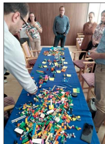
Kreatív játékkal gyűjtöttek ötleteket.

nagyot álmodni, hiszen akkor juthatunk egyről a kettőre, ha merész, de nem lehetetlen terveink vannak. Jó volt kicsit együtt játszani, a hagyományos irodai munkából kiszakadni. A bicikliút és a kikötő biztosan el fog készülni Murakeresztúron, remélem, erre a két beruházásra sok új fejlesztést tudunk majd felfűzni, hogy minél több vendéget ide tudjunk csábítani: gyönyörű fekvésű településünkre, Murakeresztúrra.”