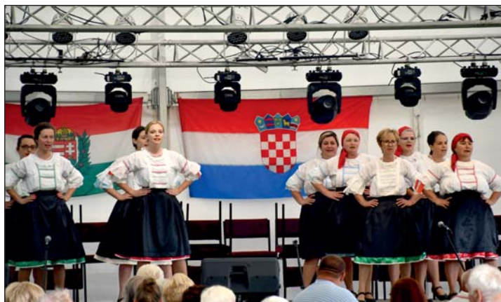
A „Regica” Horvát Néptáncegyüttes.