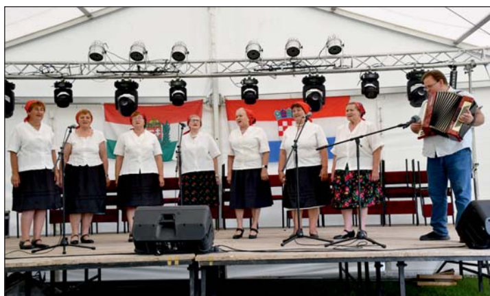
A Fityeházi Hagyományörző Kórus.