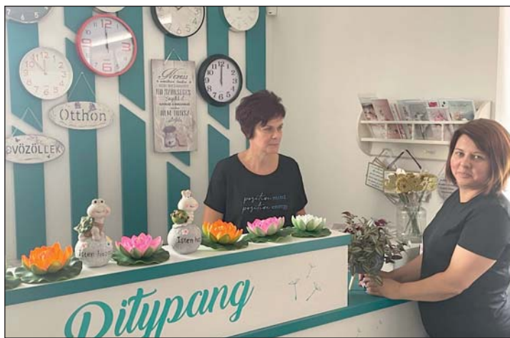
Pitypang virág- és ajándékolt.