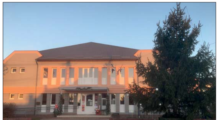
Szép fenyővel ünneplik a megváltó születését Murakeresztúron.