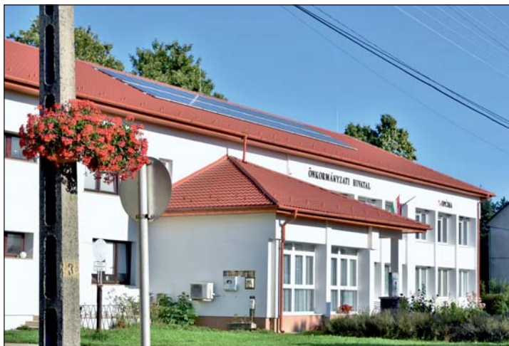
Keresztúr a zöld fejlődés útját járja.

„Egy település fejlettségi szintjét nem az infrastruktúra fejlettsége jelzi, hanem az ott élő emberek jó együttműködése” – Kemény Bertalan , kiváló vidékfejlesztő vallotta ezt, akire sokan a mai napig felnéznek, és akitől rengeteget tanulhattak a magyar vidék elkötelezett hívei arról, hogyan érdemes egy közösséget, egy települést fejleszteni.