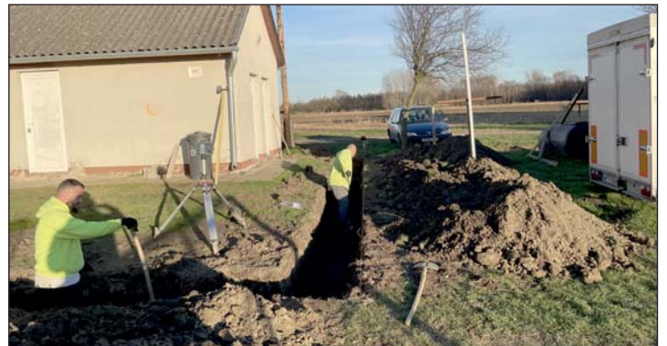
Jövő tavaszra elkészülhet az új sportöltöző a kerestúri focipályánál.

De építettek egy új műfüves kispályát is, ahol a gyerekek és a felnőttek is jobban tudják gyakorolni a kombinatív, rövid és gyors passzos játékot, és ahol kispályás kupákat is tudnak rendezni. Az egyesület folytatja a sporttelep fejlesztését, hogy XXI. századi körülményeket teremtsenek a gyerekek fejlesztéséhez, a felnőttek sportolásához.