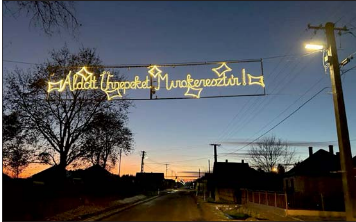
Idén is felgyulladt az ünnepi köszöntő a Mura-parti település határában.