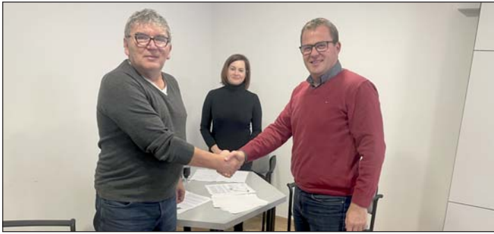
Közösen a két település fejlődéséért.