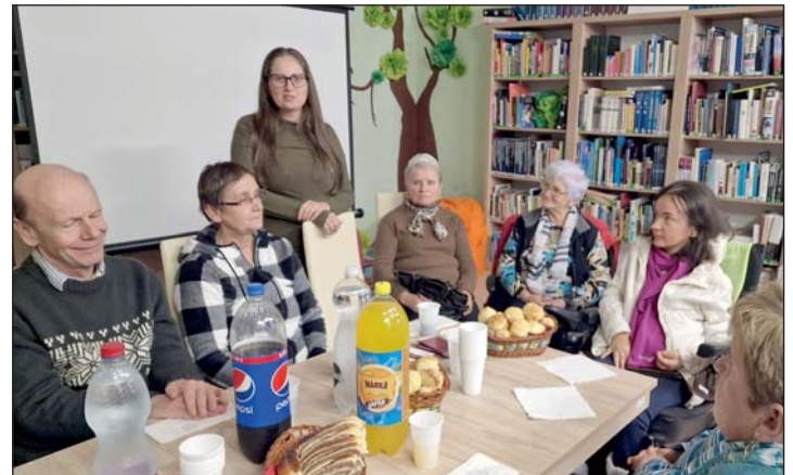
Áttekintették a 2024-es év történéseit.