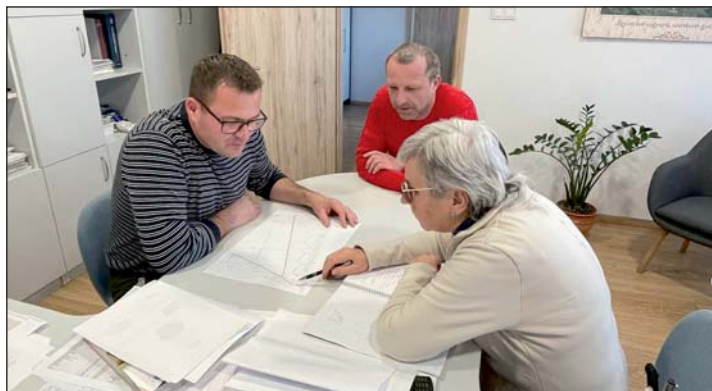
Terveket szönek új utak rendbetételére.

lázat megújul, újra csempézik a mosdót, a mellékhelyiséget is. Nemcsak takarékos, de gyönyörű, modern és otthonos is lesz az óvoda. Olyan, amire minden keresztúri család büszke lehet. Ahová örömmel járnak majd a gyerekek, ahol szívesen hagyják a szülők a csemetéiket.